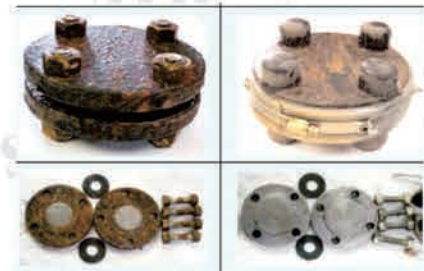
Antes de usar Después de usar