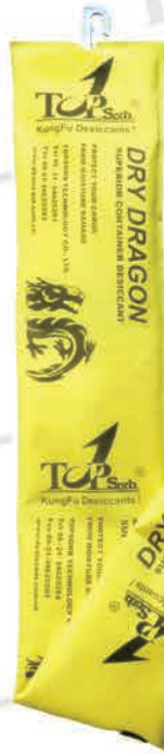
Dry Dragon-1000 (Paquete doble)