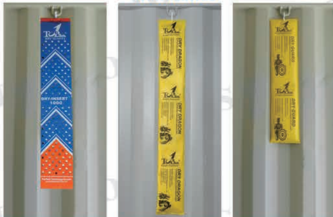
Dry Insert, Dry Dragon-1000, Dry Guard-500 Puede ser montado en el contenedor

Perfecto para adaptarse a los diseños de ranuras de contenedores