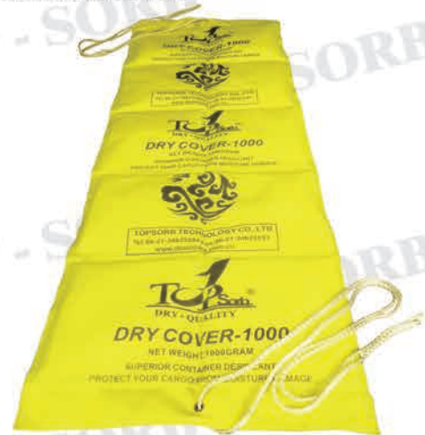
Dry Cover-1000 (Diseño de manta)

Dry Insert-1000 , Peso absorbente: 1000g, diseño de empaque rígido con aspecto y forma agradable con el objeto de mejorar la imagen del usuario.