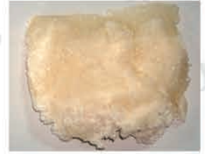
Antes de la adsorción Después de la adsorción