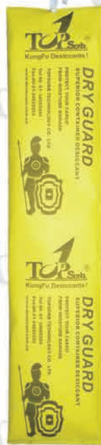
Dry Guard-500 (Paquete doble)